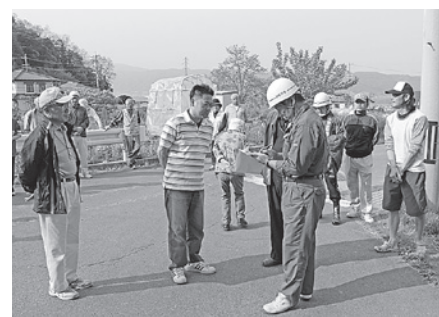
避難誘導訓練（武居地区住民）

今年度は下諏訪向陽高校第1グラウンドを主会場に土砂災害・水防訓練を実施しました。諏訪建設事務所職員の指導のもと、消防団、赤十字奉仕団、消防防災協力員、各区自主防災会と武居地区住民にご参加いただき、各種水防工法、避難誘導、救急講習、炊き出し等の各訓練を行いました。