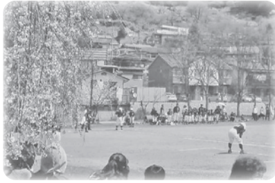
少年野球 (高浜運動公園)

れません。仕事柄、町の中をてくてく歩くことが多いのですが、知らない道、知らない場所の多いことに気づかされます。発見できる宝がいっぱいのお町、家族と、友だちと、イベントも利用して、たくさん歩きたいですね。住む人も町そのものも健康で長生きできるように、町の皆さんで考えを出し合い、自分たちの町の将来を人任せにせず、力を出し合っていけたらいいなと思います。若い人たちは、人生の先輩である方々を敬い、ご年配の方々には、まだまだ未熟な若者たちを温かく指導し見守っていただいて(ずうずうしい!!)、仲良く暮らしていいから嬉しいです。