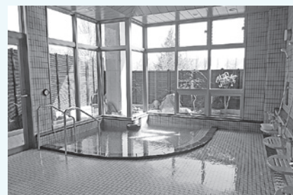
いちょうの湯(内湯)