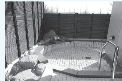
いちょうの湯(露天風呂)