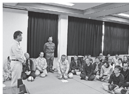
武居公会所で防災講習会を実施