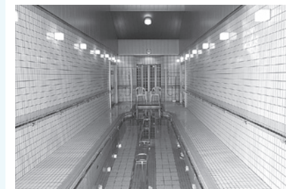
歩行浴プール 水中で簡単な運動ができます！