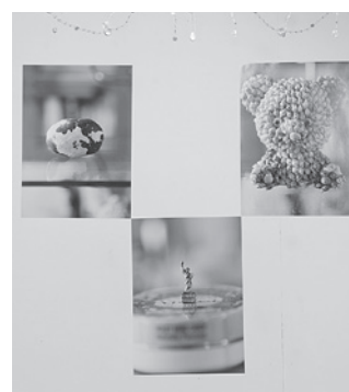
写真展 「すみれ洋裁店」より

ここは商店街の一角だから商店の一つとして、開けてみようと思いついたのが二〇一三年の夏。自分のポストカードや自分で作った本、所属ユニットPom Pom(ポムポム)のクラフト作