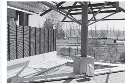
あじさいの湯(足湯) 諏訪湖が一望できます！